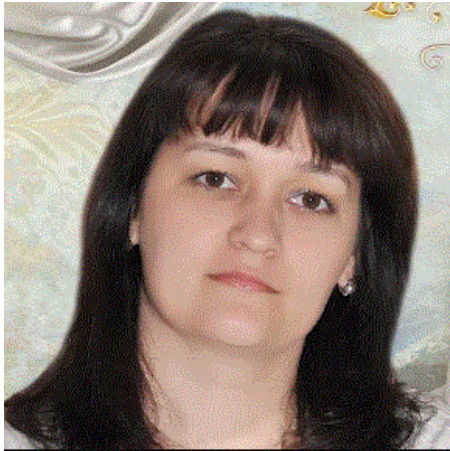
Directori adjunct, Liceul Teoretic „Mihai Eminescu”, Bălți