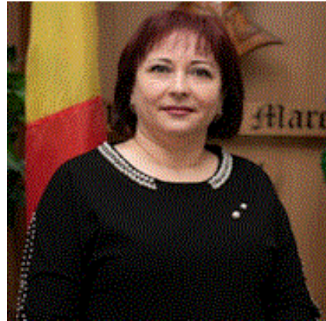
Director adjunct, Liceul Teoretic „Ștefan cel Mare”, Bălți

Sesiunile de formare organizate în cadrul proiectului sunt un prim pas pentru evaluarea nevoilor și problemelor proprii. Sper că aceste reflecții individuale vor duce la conștientizarea situației la zi pentru fiecare instituție în parte, cât și la alegerea soluțiilor proprii și optime de asigurare a factorilor implicați în procesul de luare a deciziilor la toate treptele de școlaritate.