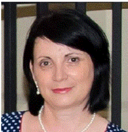
Profesor de Educație pentru societate, IP Liceul Teoretic Republican „Ion Creangă”, Bălți

Spiritul de cetățean activ și democrație se dezvoltă mai ales datorită unor procese parcurse de viitorii adulți. Proiectul ce se referă la educație democratică în școli oferă atât adulților cât și elevilor oportunitatea de a fi parte a unui proces integrat și democratic. Am convingerea că participanții vor învăța mai mult despre conceptul de democrație și vom obține împreună experiențe frumoase.