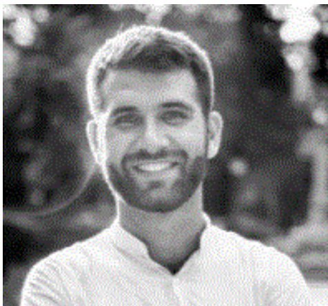
Psiholog și consilier, CRCT ARTICO

Schimbările democratice tind să fie durabile. Sunt încorporate și cresc atât timp cât se lucrează consecvent în acest sens. Este drumul cel bun, dar poate fi mult de muncă. Însă doar împreună totul ne va reuși. Vă doresc atât curajul necesar, cât și succesul care va veni în călătoria noastră pe tot parcursul proiectului.