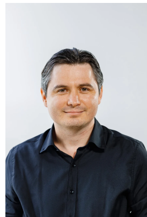
Director, Institutul de Instruire în