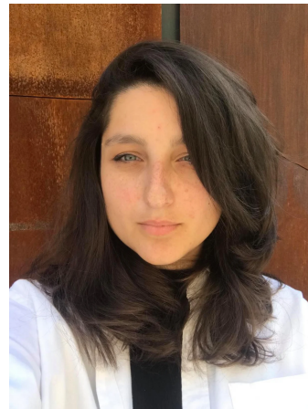
Manager de proiecte, Consultant în dezvoltare organizațională, Formatoare în domeniul electoral

Școala este acea instituție care are menirea să pregătească viitorii cetățeni, astfel în școală trebuie dezvoltate acele inițiative ce vor contribui la dezvoltarea competențelor elevilor pentru o cultură democratică. Chiar din primele activități, ca și formator în cadrul proiectului, am avut situații pe care nu le-am mai experimentat până acum și care m-au bucurat.